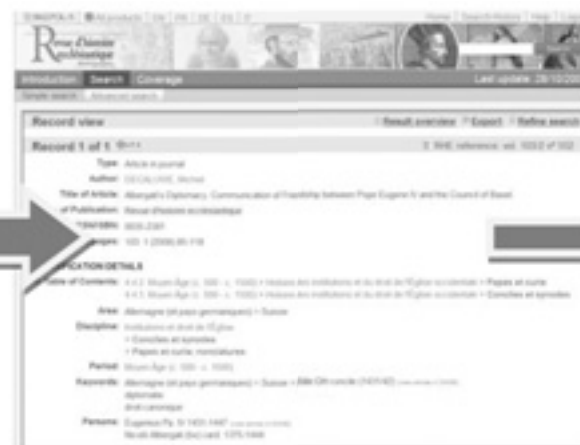
Find bibliographical notes in the RHE: bibliographie Recherche de notices dans la RHE: bibliographie