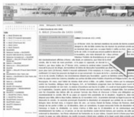
View of an entry of the DHGE Vue d'une entrée du DHGE

The institutions from developing countries (following the World Bank classification) with subscriptions to the printed version of the RHE will continue to benefit from free access to the basic version of the RHE: bibliographie . A list of these countries is available on the RHE website: http://www.rhe.eu.com/ .